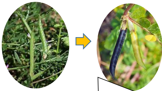
カラスノエンドウ

種がカラスのように黒くなります！ おうちのまわりで探してみてください！ また散歩でも見つけようね♪